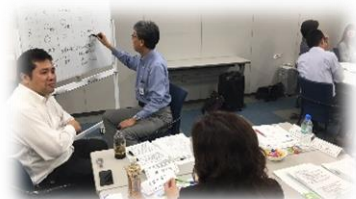
他社メンバーとの協力・学び合い

そのほか、 過去参加組織との交流イベント や、 オンラインでの個別相談会 等を通じ、貴組織の 健康いきいき職場づくりの計画・実践 をご支援します！