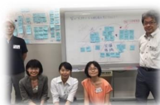
ワークショップでの交流