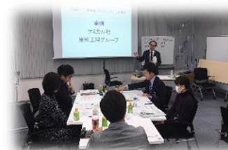
行動計画の策定・発表