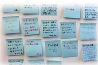
組織課題の洗い出し