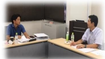
専門家との討議・個別アドバイス