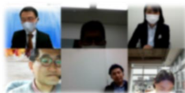
オンラインでの交流イベント